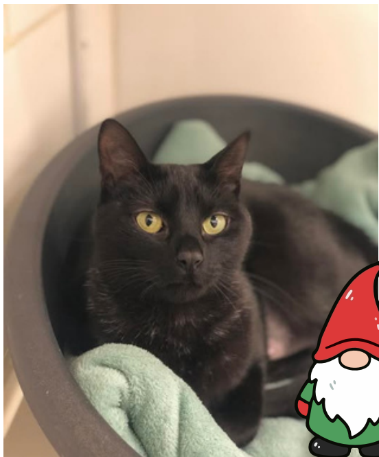
-Gaïa- Au refuge depuis 4 mois