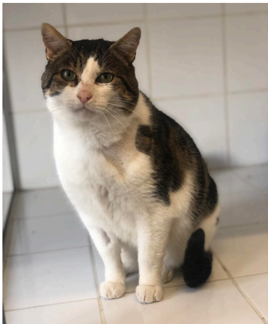
-Valentin- Au refuge depuis 3 mois