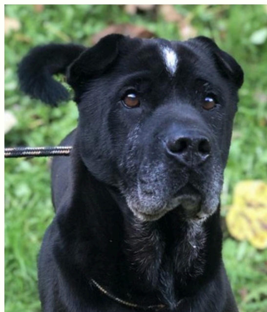
-Amo- Au refuge depuis 4 ans

Venez donc vite faire la rencontre d'Amo au refuge !